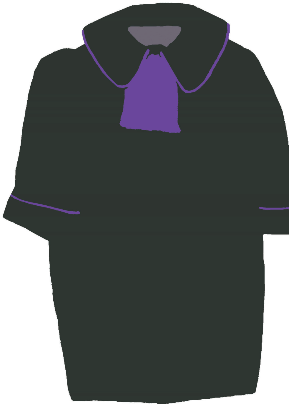
widok z przodu