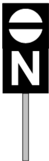
Rys. 68a Sygnał Z 1p

Załącznik do rozporządzenia Ministra Transportu, Budownictwa i Gospodarki Morskiej z dnia 6 września 2012 r. (poz. 1042)