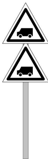
Rys. 171a Wskaźnik W 6b