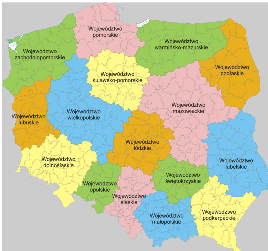
Mapa 2. Podział administracyjny Rzeczypospolitej Polskiej.

Program wprowadza się na terytorium Rzeczypospolitej Polskiej. Programem jest realizowany na obszarze 16 województw, obejmujących 314 powiatów oraz 66 miast na prawach powiatów.